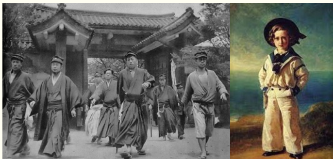
ยูนิฟอร์มนักเรียนญี่ปุ่นในปี 1949 เจ้าชายเอ็ดเวิร์ดทรงชุดกะลาสีเรือ

ยูนิฟอร์มนักเรียนญี่ปุ่นที่พวกเราคุ้นเคยนั้นเรียกว่า “Seifuku” (制服) ซึ่งมีความคล้ายคลึงกับชุดกะลาสีเรือ โดยนำมาใช้ในช่วงปลายศตวรรษที่ 19 ก่อนหน้านั้นนักเรียนหญิงจะสวมใส่กิโมโน (着物) ส่วนนักเรียนชายจะสวมฮะกะมะ (袴) เนื่องจากชุดกิโมโนและชุดฮะกะมะ ซึ่งวัฒนธรรมการใส่ชุดกิโมโนและฮะกะมะได้สืบทอดมาตั้งแต่ปัจจุบันกลายเป็นเครื่องแบบในงานจบการศึกษาแทน สำหรับชุดนักเรียน Seifuku นั้นได้รับอิทธิพล