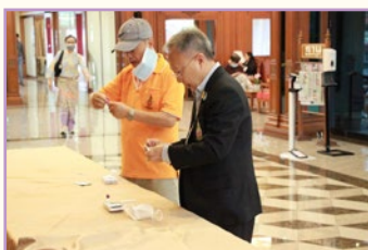
ตรวจ ATK ก่อนเข้าประชุม