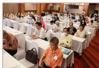
สมาชิกเข้าร่วมประชุม