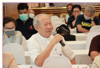
สมาชิกให้ข้อเสนอแนะ