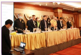
ยื่นไว้้อาลัยให้กับสมาชิกที่ล่วงลับ