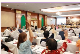
ยกมือรับรองการประชุม