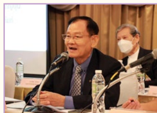
นายกฯ และคณะกรรมการร่วมกล่าวรายงาน