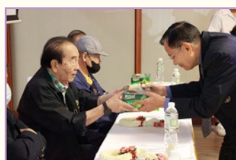
พิธีขอพรโดเซมโป