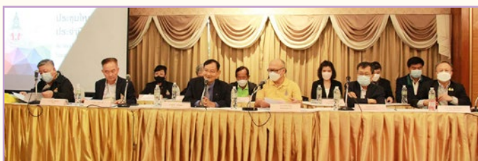
คณะกรรมการบริหาร