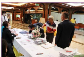
ลงทะเบียน