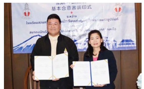
กรรมการบริหารฝ่ายสวัสดิการสมาชิกและ ที่ปรึกษา โรงเรียน ส.น.ญ. และ รองประธาน ฝ่ายวิชาการ ส.น.ญ.บ.