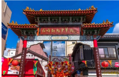
Nagasaki China Town