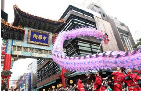
Yokohama China Town