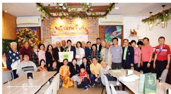
งานส่งท้ายปีเก่าและต้อนรับปีใหม่ 2567 ที่ ส.น.ญ.บ.