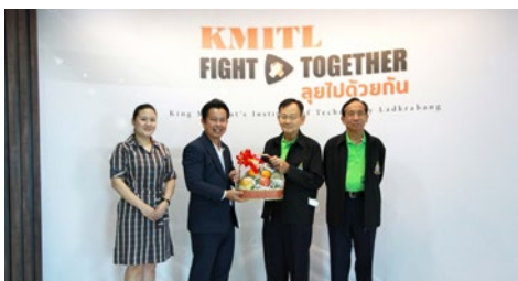
รศ.ดร.คมสัน มาลีสี อธิการบดี สจล.