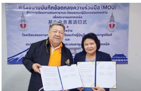
เทร่ญญิก ส.น.ญ. และ รองประธาน ฝ่ายพัฒนาองค์กรและเทร่ญญิก ส.น.ญ.บ.