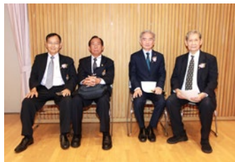
ท่านนายกและคณะกรรมการ ส.น.ญ.