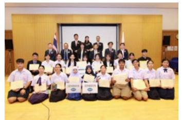
ท่านกรรมการตัดสิน ท่านนายก ส.น.ญ. และ ผู้เข้าประกวดทุกประเภท