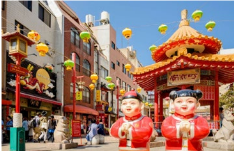
Kobe China Town