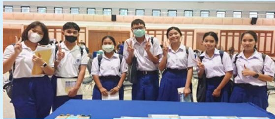
โรงเรียน มหาวชิราวุธ จ.สงขลา