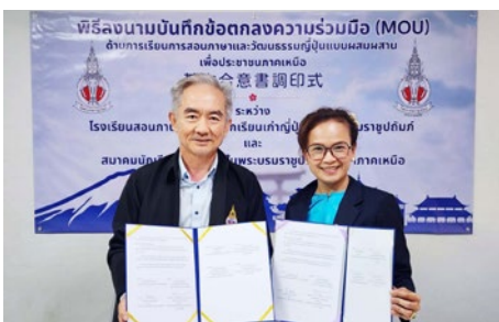
เลขาธิการ ส.น.ญ.และ เลขาธิการ ส.น.ญ.บ.

การลงนามในครั้งนี้ เป็นการสร้างความร่วมมือเพื่อส่งเสริม การเรียนรู้ด้านภาษาและวัฒนธรรม รวมทั้งการวางแผนร่วมกัน ในการพัฒนาองค์ความรู้ภาษาญี่ปุ่นสำหรับกิจการโรงงาน อุตสาหกรรมในภูมิภาคเหนือ ทั้งนี้ความร่วมมือดังกล่าวจะเป็นการ สานสัมพันธ์ไทย-ญี่ปุ่นให้แน่นแฟ้นยิ่งขึ้น ทั้งในสวนวัฒนธรรม การศึกษา อุตสาหกรรม และ สังคม และส่งผลให้ผู้เรียนของ ส.น.ญ.บ. นั้นได้รับสิทธิประโยชน์หลายประการ