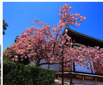
Kanzan sakura ที่วัด Myorenji (妙蓮寺) เมืองเกียวโต