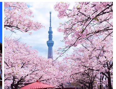
Yoshino sakura ริมน้ำสุซิมิตะ (隅田川) กรุงโตเกียว