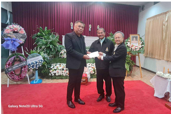
Galaxy Note20 Ultra 5G

ขอแสดงความเสียใจกับครอบครัวโตพิบูล ที่สูญเสีย คุณแม่อัจฉณา โตพิบูล คุณแม่ของคุณศุภชัย โตพิบูล (อดีตกรรมการสมาคมนักเรียนเก่าญี่ปุ่นฯ)