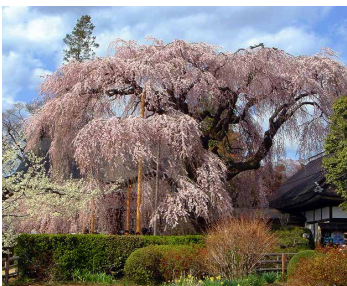
Ito sakura อายุ 300 ปี วัด Jionji (慈雲寺) จ.ยะมะนะชิ