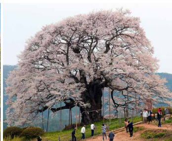
Daigo sakura อายุกว่า 1,000 ปี เมืองมะนิวะ จ.โอคะยะมา