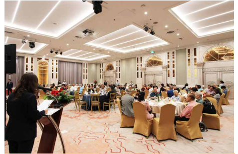
บรรยากาศภายในงานเลี้ยงสังสรรค์ ส.น.ญ.