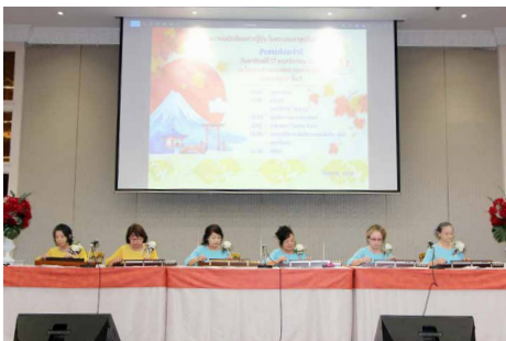
การแสดง Taisho Koto