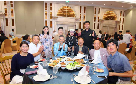
แขกผู้มีเกียรติจากสถานเอกอัครราชทูตญี่ปุ่น, Jetro, JCC, JAT และ Jasso ถ่ายภาพร่วมกับ กรรมการบริหารสมาคมฯ